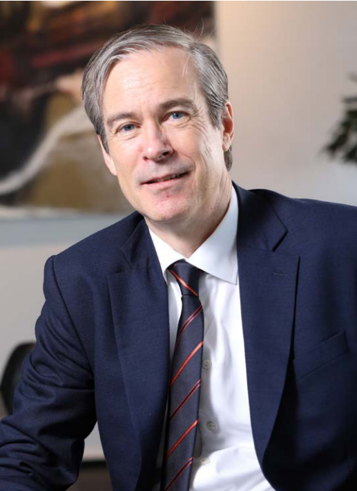
VD för Qlife Holding AB

Qlife ser starka trender mot decentraliserad testning och diagnos, utan att klinisk precision, behandling och professionell analys av data går förlorad. Covid-19 är ett utmärkt exempel som visar på fördelarna med decentraliserad testning.